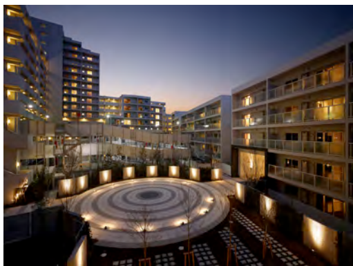
アルティス西ヶ原パークヒルズのパティオ