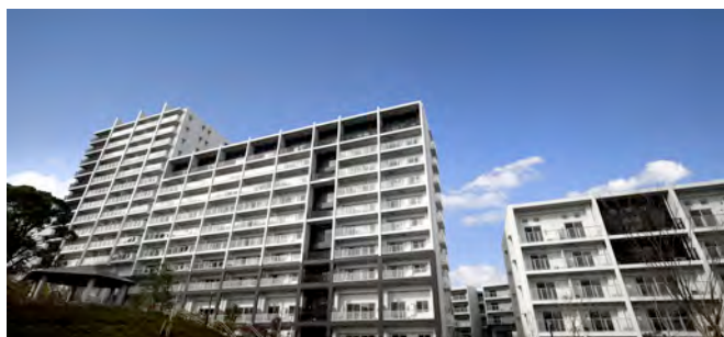
アルティス西ヶ原パークヒルズに隣接する公園より現地を望む