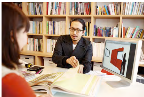
blue studio担当者が、カスタマイズプランを コンサルティングしてくれる

入居者が、好きなウォールクロスやタイルカーペットを選べるだけではありません。プロの建築家（blue studio）と一緒に選べることで、初めてのカスタマイズでの不安を払拭します。以下のSTEPにて、「あなたが本当に住みたい家はどんな家か？」コンサルティング。 STEP1) お気に入りの本・好きな音楽・・・入居者様にご質問させて頂き、潜在的趣向をカウンセリング。 STEP2) お部屋とあなたに合うカスタマイズプランをプロと一緒に考えます。 STEP3) レイアウトしたい家具の相談、ショップのありかなどお部屋のコーディネートプランもアドバイス。