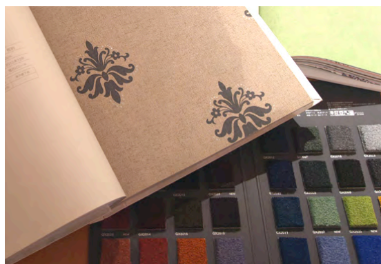
カスタマイズプランのタイルカーペット。約30色の中から、 自分好みのカラーをセレクト