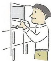
シェアロッカーから 取り出す