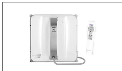
【窓拭きロボット】エコボックス社製 WINBOT 850