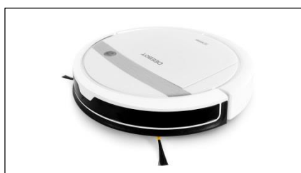
【お掃除ロボット】エコボックス社製 DEEBOT M88

本サービスは、各住戸の非接触キーを使って利用状況の管理を行います。また、フルタイムシステムが運営する24時間365日対応の「FTSコントロールセンター」、及び、空き状況をスマートフォンで確認できる「Web-check system」を利用することで、サービスを管理する人がいなくても、入居者はシェアリングサービスをいつでも自由に利用することができます。