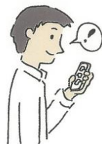
スマートフォンで 空き状況をチェック

今回提供するシェアリング用品は、①あると便利だが頻繁には使わない②使ってみたいが高価なのでシェアしたい③宅配ボックスに格納できるサイズ の3つの観点から、IOT家電である『お掃除ロボット』と『窓拭きロボット』を選定しましたが、今回の試行により、利用状況や傾向、問題点、入居者の意見や要望などを抽出・分析し、シェアリング用品の変更・拡充も含め本サービスがより便利になるよう改善を重ね、物件タイプや入居者の属性・ニーズに合わせ他の物件への展開を図っていく予定です。