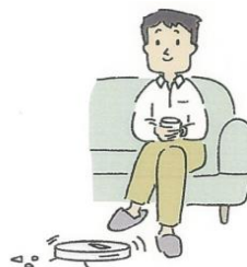
使い終わったら シェアロッカーへ返却!