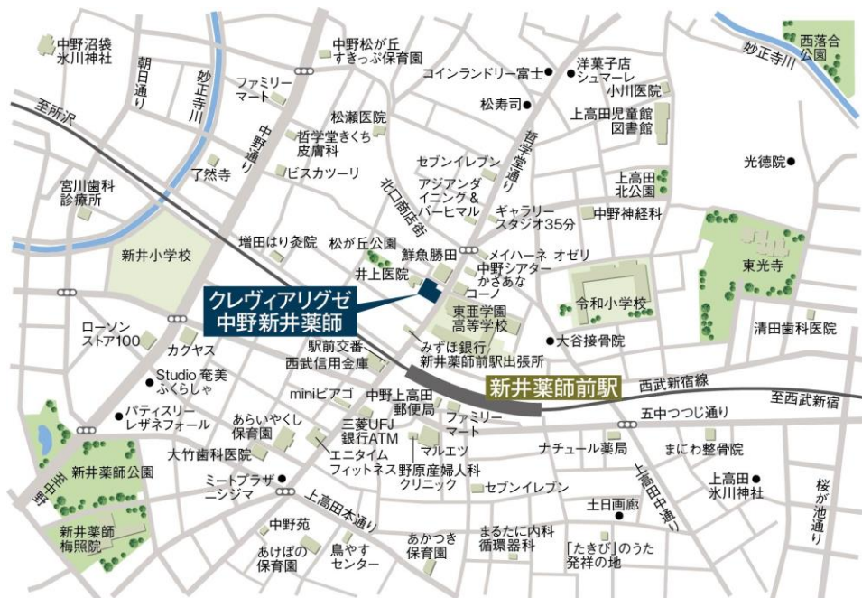
< 物件位置図 >