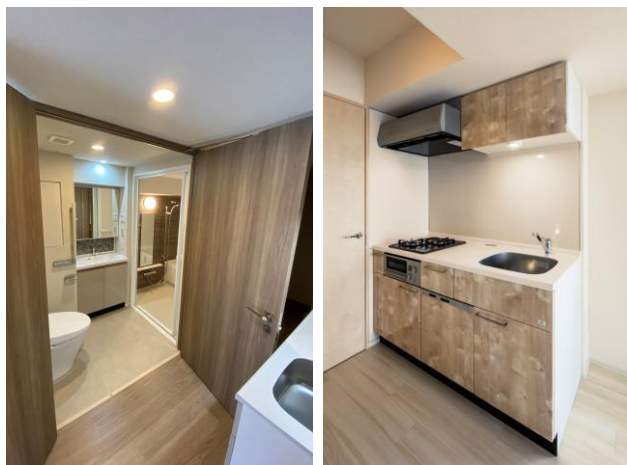
(左)ゆとりのある洗面・バスルーム (右)システムキッチン